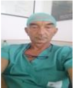
Prof. Paolo Urciuoli - Consulente Sanitario Nazionale ASSILT

Per prevenire le disabilità dell'apparato locomotore diventa quindi fondamentale riuscire ad intervenire prima che sia troppo tardi. Il "15% degli italiani dichiara infatti di non aver mai sentito parlare delle malattie reumatologiche. E più della metà non sa che si possono prevenire. Una scarsa consapevolezza che può avere effetti nefasti sull'intero sistema sanitario nazionale e che va quindi contrastata al più presto".